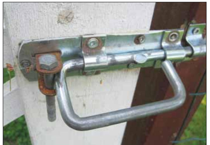
Tätä lapsi ei saa auki.