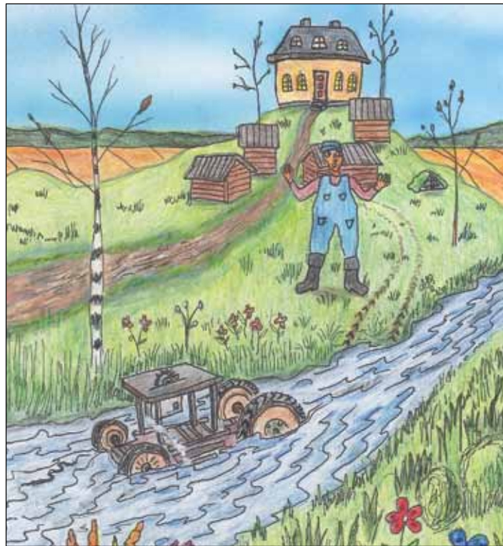
Aleksin kuvitusta uuteen kirjaan, Teneriffan kissat.

Opetus: Olemattomien ongelmien ratkaiseminen ei onnistu, vaikka kaikkensa yrittäisi.