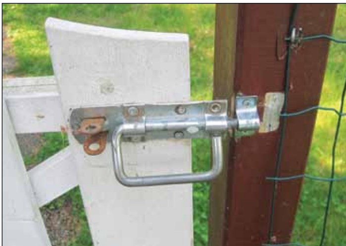
Tämän lukon saa avatuksi.