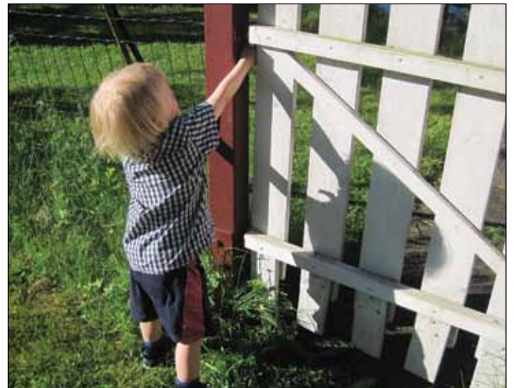
Laiturille pitäisi päästä.

Vaaroihin varautumisen tarkoituksena ei ole pelotella ja aiheuttaa huolta. Päinvastoin. Kun tietää, että ympäristön vaaranpaikat on etsitty ja estetty, voi nauttia elämästä.